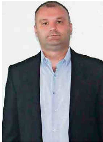
Žuga: Sporno je sve što ima prefiks državno

Tražili smo povećanje državnog budžeta, ali nije usvojen fiskalni okvir za period 2017. do 2020.